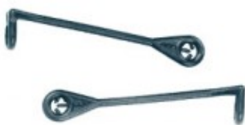
Composè 2 per completi Modello a Bastoncino