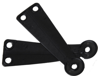
Composè 1 per completi Modello a Triangolo