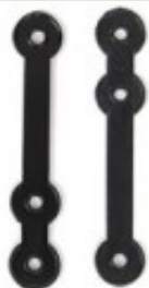
Composè 3 per completi Modello a Fettuccia