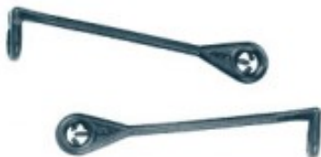
Composè 2 per completi Modello a Bastoncino