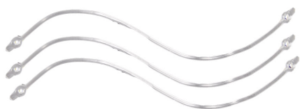
PVC Fils arrêts pantalons